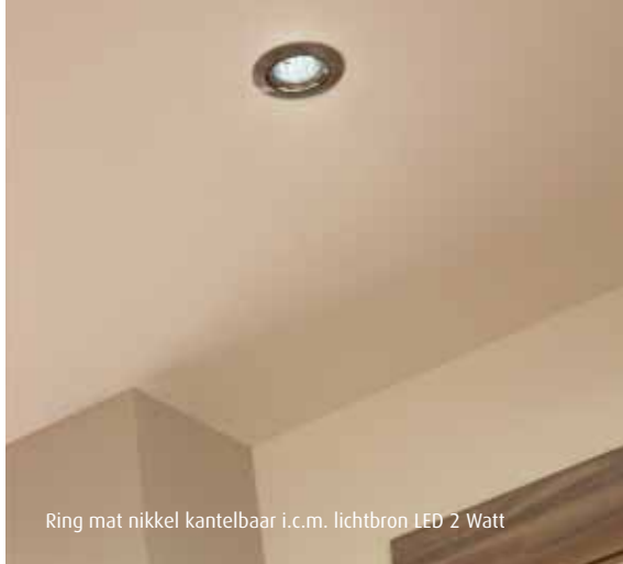
Ring mat nikkel kantelbaar i.c.m. lichtbron LED 2 Watt